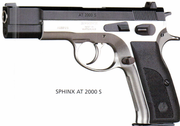
SPHINX AT 2000 S