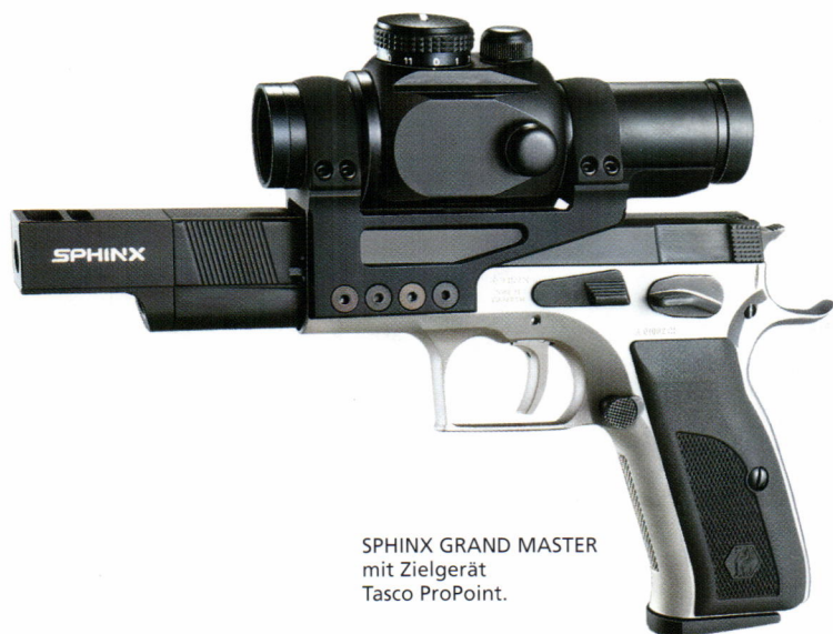
SPHINX GRAND MASTER mit Zielgerät Tasco ProPoint.