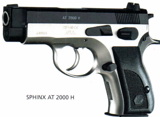
SPHINX AT 2000 H