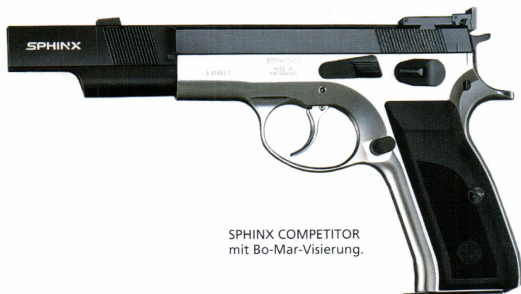
SPHINX COMPETITOR mit Bo-Mar-Visierung.