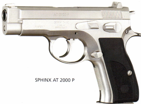
SPHINX AT 2000 P